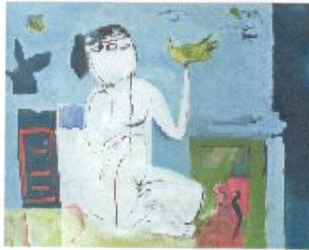
O 1089 Kraicová, Viera Biely akt